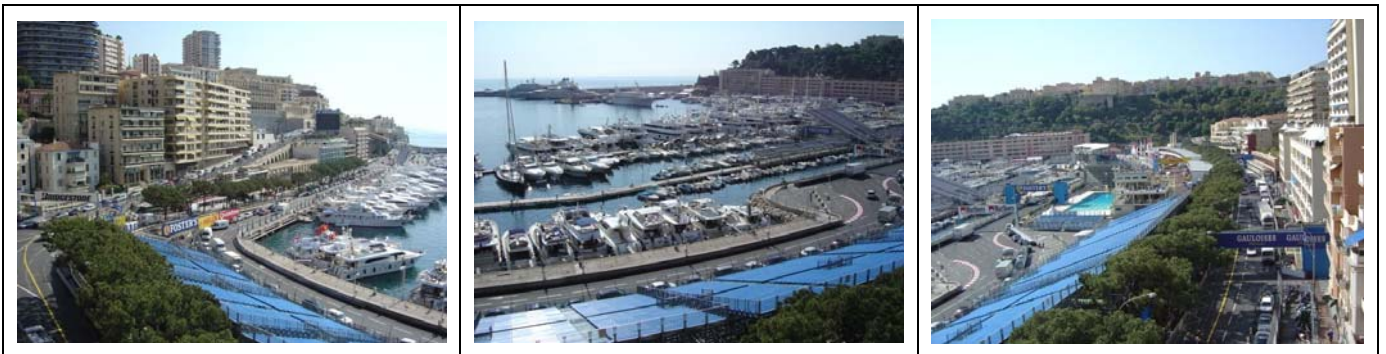
左・中・右—K1～K8スタンド(一番大きなスタンドです。)

上の写真は、過去参加された方が撮られた各スタンドからのイメージ参考写真です。大体この様な風景となります。 中断、左—A1スタンド(1コーナー)、中—Vスタンド(最終コーナー)、右—Xスタンド。近すぎます。ありえない音量です。目前でバーンナウトあり。要注意。 ※主催者側の都合により、スタンドの設定は毎年少しずつ変化する事をご了解下さい。